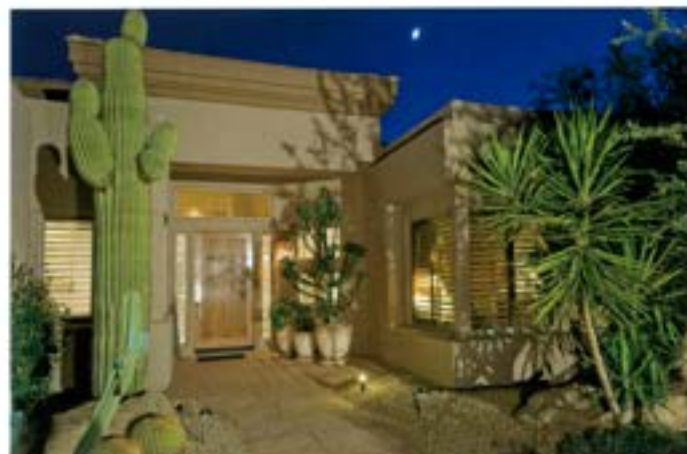
クラック補修後、リニューで仕上げ塗装