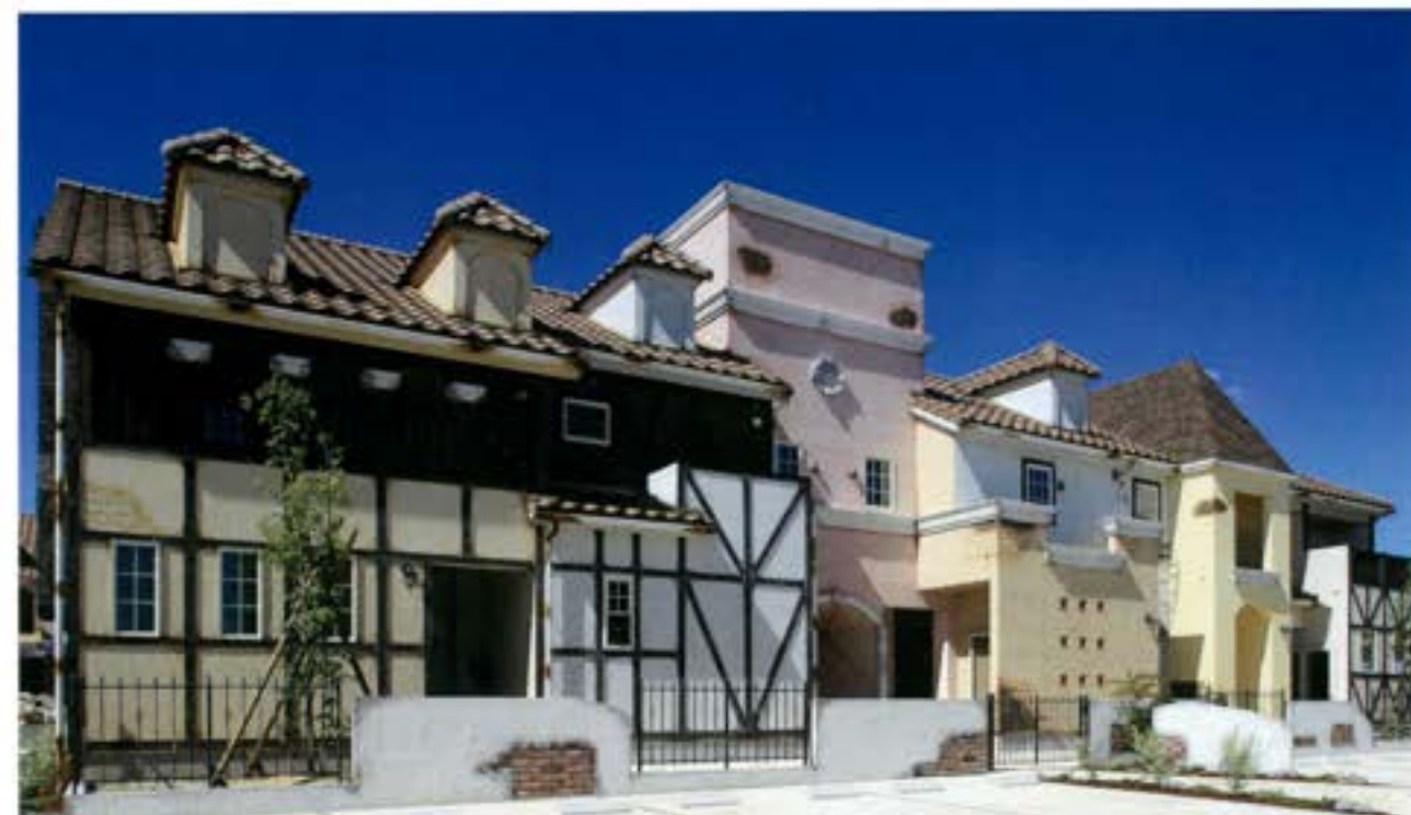
インテリアの始まりは外観から