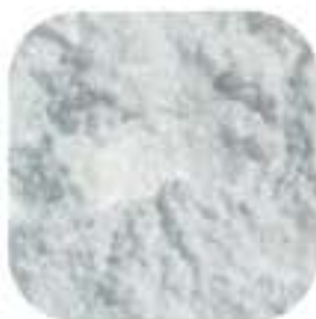
高品質アクリルポリマー