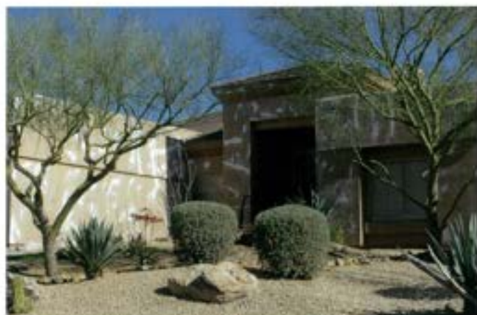
他社スタッコの施工で発生した無数のクラック補修