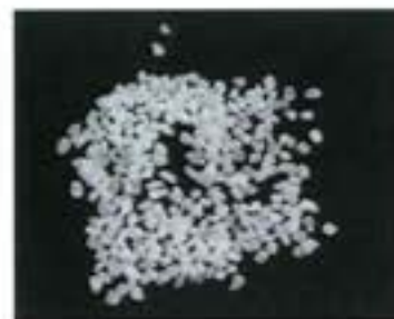
不純物を含まないカルシウムサンドをパウダー状で配合、塩害抑制