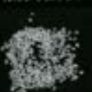
カルシウムサンド

使用している骨材は、鉄分や不純物を含まず、湿じり気のないカルシウムサンドのため、腐食による経年劣化を抑え、美観を維持します。