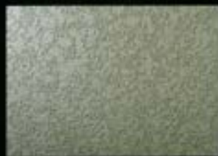
ロック吹・ヘッドカット